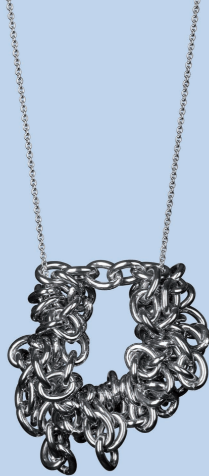
DUO Halsschmuck aus 2 Ketten

Ketten aus der industriellen Modeschmuckproduktion werden beispielsweise von der Künstlerin durch die Bearbeitungsweise oder durch konzeptionelle Umdeutung verfremdet.